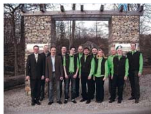
"Wir stehen zur Gemeinschaftsschule" (von links): Die Vertreter des Vereins am Limes mit den heimischen Handwerkern, die die Schulstandorte Denkendorf und Kipfenberg stärken wollen.

Denkendorf (EK) Der Verein Bildung am Limes bekommt jetzt für sein alternatives Schulkonzept massive Unterstützung vom heimischen Handwerk: "Die Limeshandwerker stehen zur Gemeinschaftsschule."